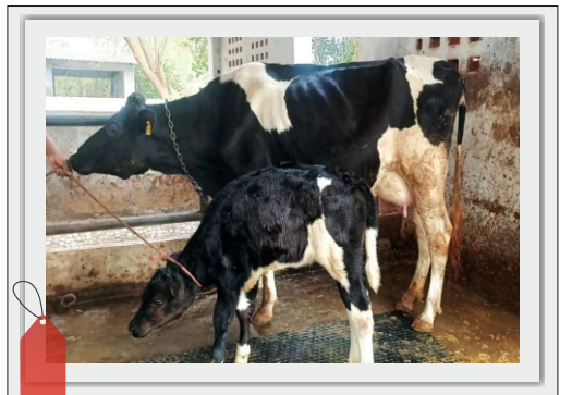
મહેસાણા દૂધ ઉત્પાદક સંઘ લી.

પશુઓમાં એમ્બ્રિઓ ટ્રાન્સફર (ET) એટલે કે ; ભ્રુણ પ્રત્યારોપણ એ પશુપાલન અને ડેરી ઉદ્યોગ માટે એક ક્રાંતિકારી વૈજ્ઞાનિક પદ્ધતિ છે. આ ટેકનોલોજીને સરળ શબ્દોમાં કહીએ તો પશુઓ માટેની "સરોગસી" (Surrogacy) જેવી જ પ્રક્રિયા છે.