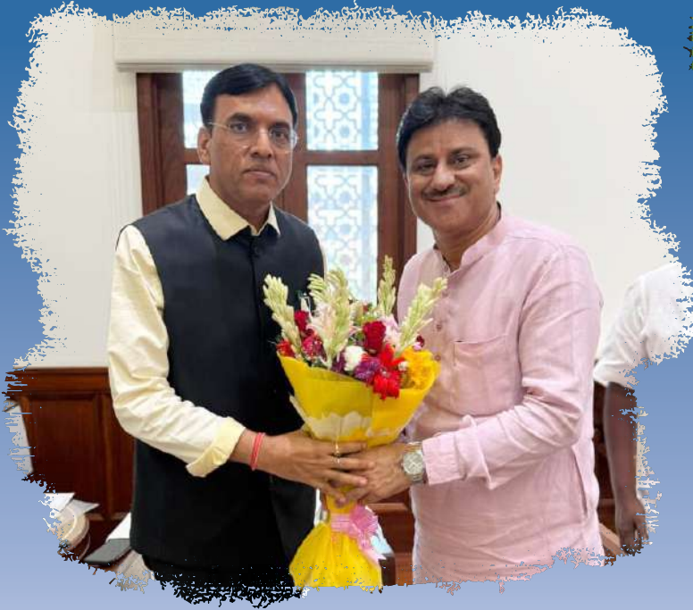
કેન્દ્રીય મંત્રી શ્રી મનસુખલાઈ માંડવીયા સાથે અમૂલ્ય મુલાકાત